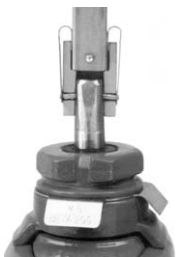
VAG KLIICK-FIX Das neue werkzeuglose Arretierungssystem