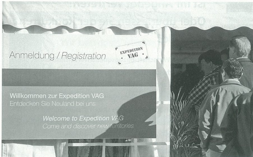
Bild 4: Viele Kunden und Mitarbeiter folgten der Einladung zur Expedition VAG.